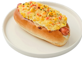
에니언 콘 치즈 핫도그