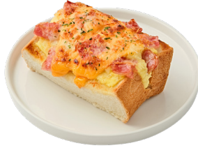
콘 에그 핫 브레드