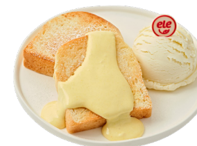
콘 크림 버터 토스트