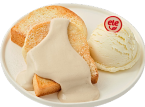
바닐라 버터 토스트