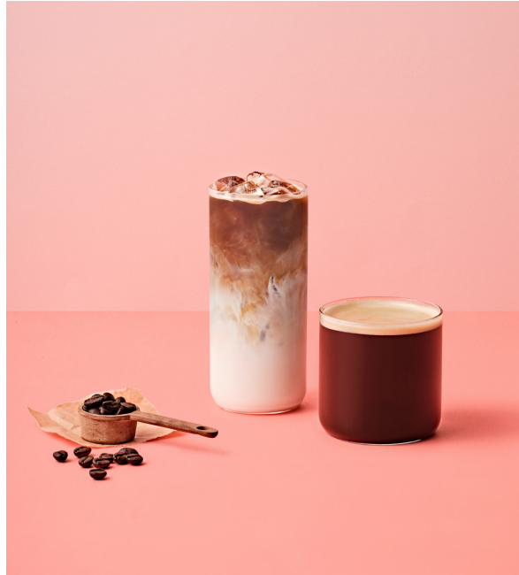
더 착한 드립 커피

눈을 사로잡는 비주얼에 폭신한 크림, 씹사름한 리스트레또의 맛이 입 안에서 조화를 이루는 셀렉토만의 시그니처 에스프레소 음료.