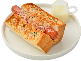
베이컨 롤 핫 브레드