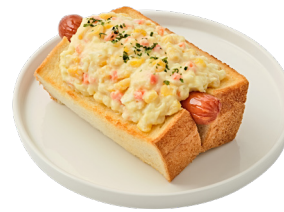
베이컨 체다 핫 브레드