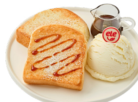
카라멜 버터 토스트