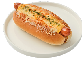
스파이스 칠리미트 핫도그