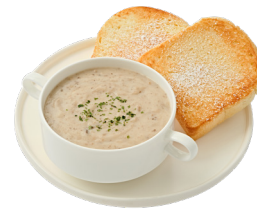
스프 페어링 SET